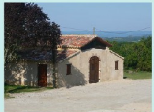
Notre atelier de production, en plein coeur du Tarn

Notre ligne de Cosmétique biologique est conçue et fabriquée en France, dans le Tarn, puis envoyée directement à notre point de vente situé au 22 rue Tronchet, dans le 8 e arrondissement de Paris, et à nos distributeurs. La fraîcheur des matières 1 o est ainsi garantie pour un résultat cosmétique irréprochable.