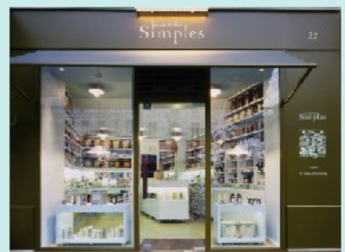
Le Carré des Simples, 22 rue Tronchet 75008 Paris